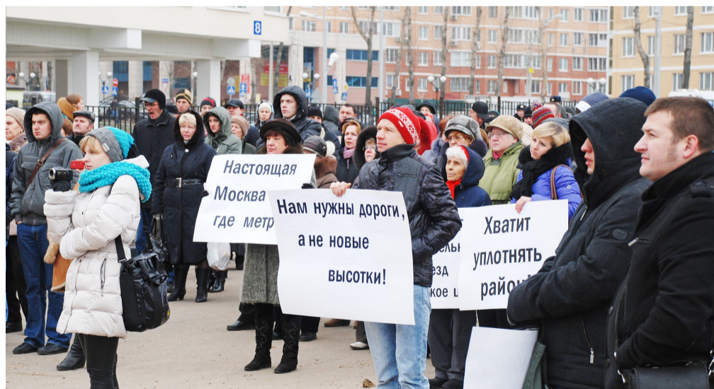
На фото митинг за развитие дорожно-транспортной инфраструктуры организованный инициативной группой поселения Московский.

Наша цель – сделать город комфортным и удобным для жизни!