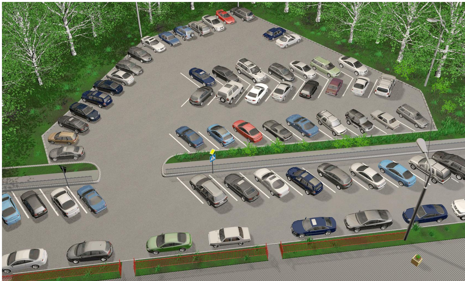
3D модель участка территории 3-го микрорайона города Московский. Вид 1.