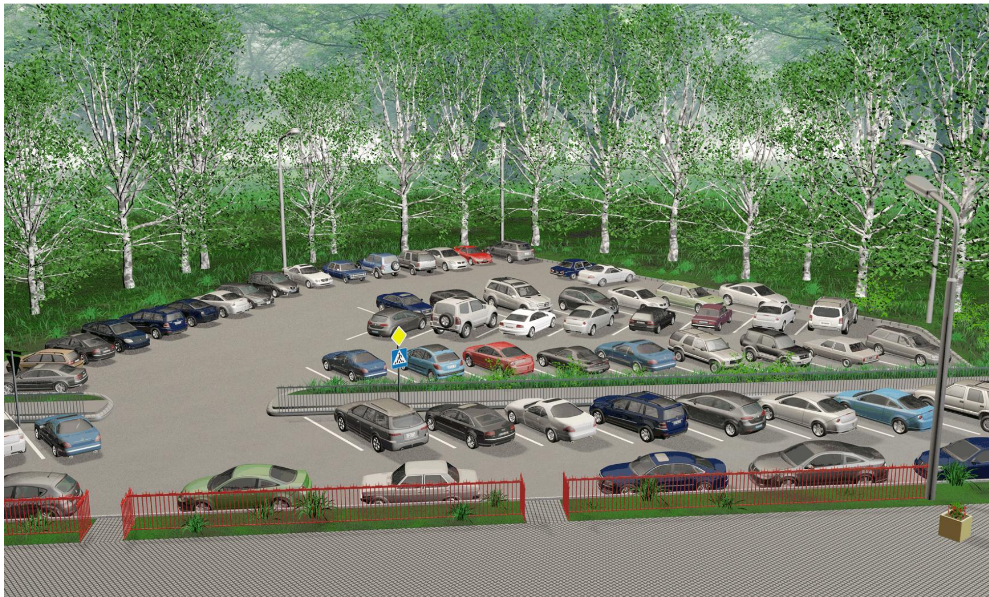
3D модель участка территории 3-го микрорайона города Московский. Вид 2.